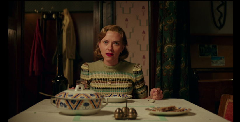
Jojo Rabbit, 2019 Dir: Taika Waititi