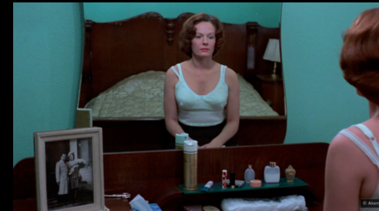
Jean Diellman, 1975 Dir: Chantal Akerman,