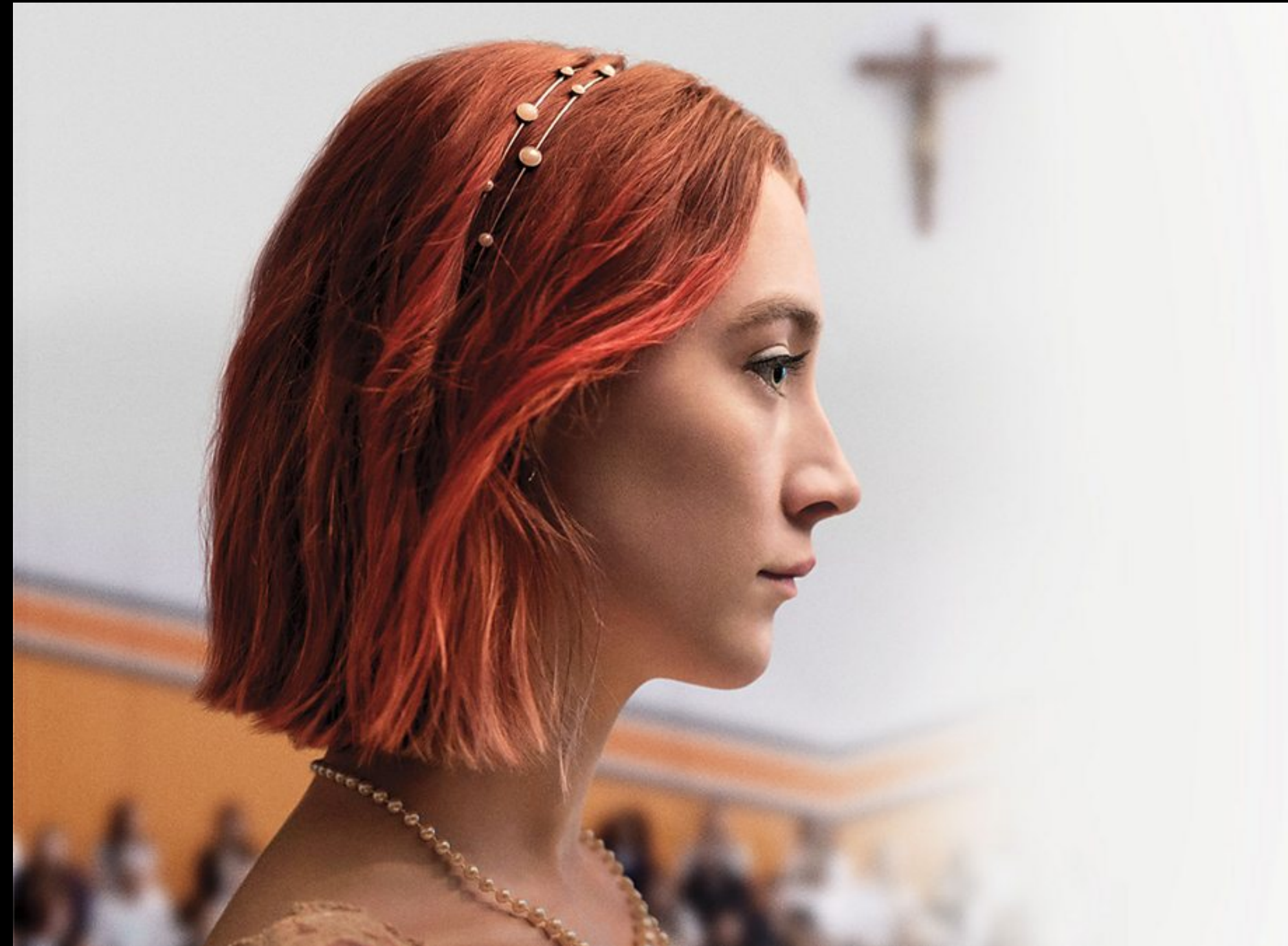
Lady Bird, 2017 Dir: Greta Gerwig

Aunque se ha criado en un hogar estricto y conservador, ha comenzado a cuestionarse el orden normal de las cosas.