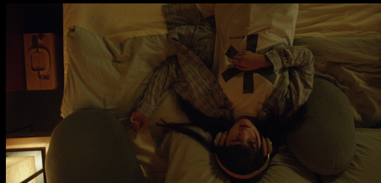
Parasitos. 2019 Dir: Bon Joon Ho