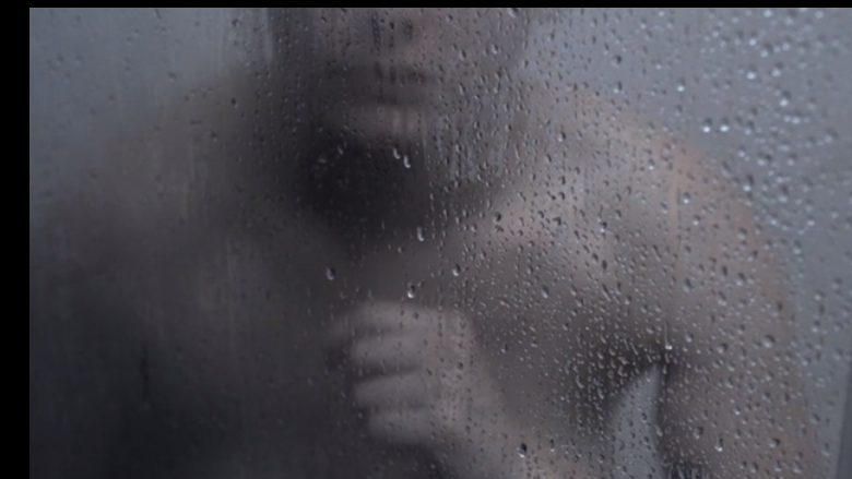
Medea, 2017 Dir: Alexandra Latishev