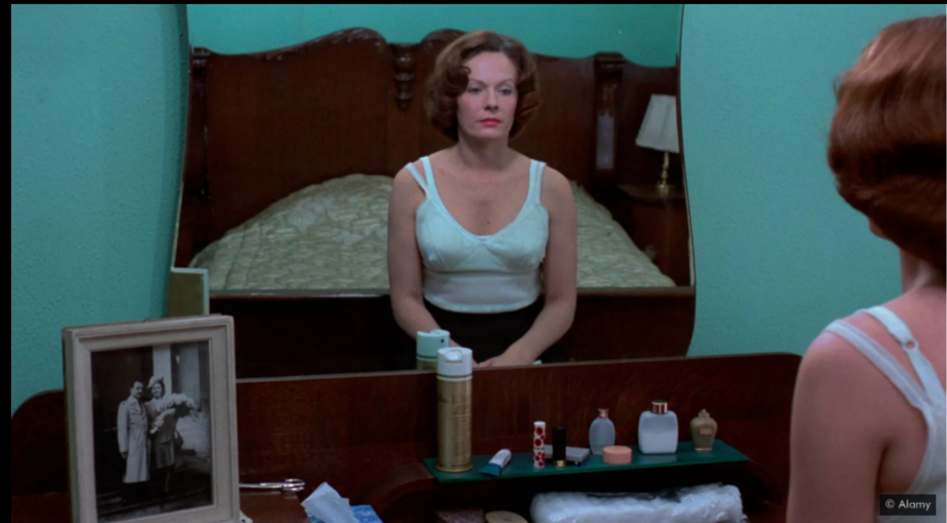
Jean Diellman, 1975 Dir: Chantal Akerman,

SUYAPA (43) es madre soltera y trabaja en una oficina del estado. Para llenar el vacío que según ella, Julia, siente por la ausencia de una figura paterna, la sobre protege y al mismo tiempo es muy estricta y dura. Es número uno en su trabajo, hasta llegar al punto de ser extremadamente perfeccionista. Con mucho esfuerzo logra ajustar la mensualidad del colegio religioso y bilingüe para clase media alta en el que estudia Julia. Hace el sacrificio para que Julia pueda codearse con sus compañeritos que tienen una mejor posición económica que ellas. Suyapa sueña con el día en que Julia se gradué de la universidad, encuentre un buen trabajo y mejore su posición económica.