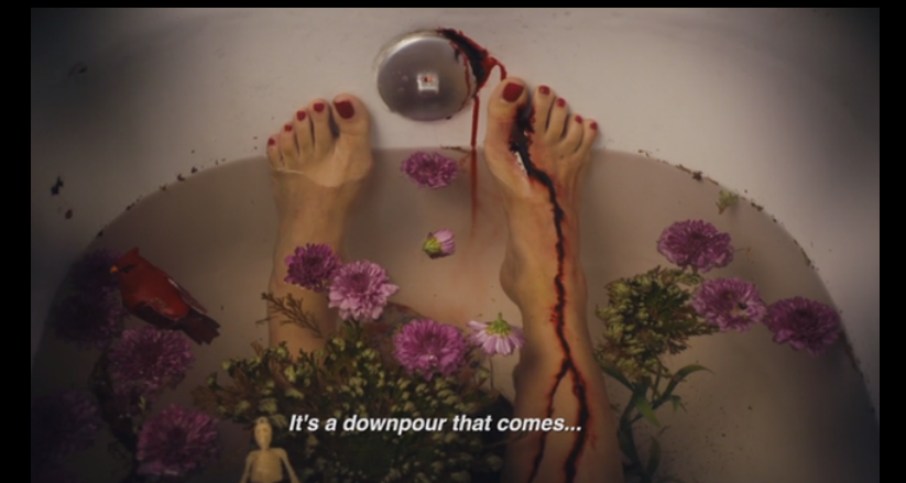
Dos Fridas, 2018, Dir: Ishtar Yasin